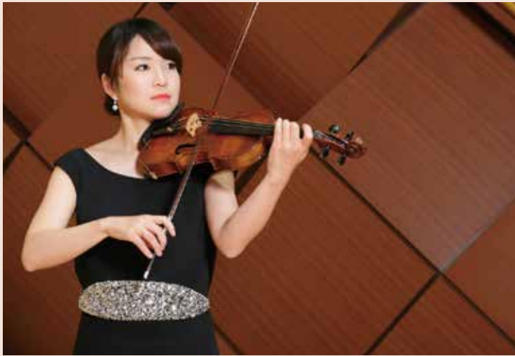
神尾真由子 (ヴァイオリン) MAYUKO KAMIO, Violin

4歳よりヴァイオリンをはじめ、2001年ニューヨークでデビュー、ニューヨーク・タイムズ紙で「輝くばかりの才能」と絶賞される。2007年第13回チャイコフスキー国際コンクールで優勝し、世界中の注目を浴びた。これまでチャールズ・イリマン、ミューン・ハン・フィル、BBC響、ベルリン・ドイツ響、ラハティ響などと共演。指揮者ではメータ、デュトワ、アシュケナーズ、ピエロフラーヴェク、L.フィッシャー、ソビエフ、カムなどと共演。またソリストとしてニューヨーク、ワシントン、サンクトペテルブルク、モスクワ、フランクフルト、ミラノなど世界各地でリサイタルを行っている。レコーディングではRCA Red Sealレーベルより最新CD「ヴァイオリン・アンコール」を含む5枚をリリース。使用楽器はストラディヴァリウス1731年製「ルビノア」を宗次コレクションより貸与されている。